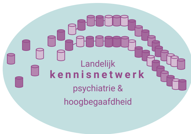
Figuur 2 Vergroot de kennis over hoogbegaafdheid bij hulpverleners in de psychiatrie.

afstemmen. Het moet daarbij duidelijk zijn wat van iedere collega verwacht wordt en het plan moet tijdig bijgesteld kunnen worden als de situatie van de patiënt verandert. Een persoonsgerichte eclectische benadering van de behandeling, waarin een multidisciplinair team elkaar optimaal aanvult ten behoeve van de patiënt die hoogbegaafd is, is essentieel voor het herstelproces.